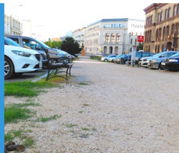
Aleje Marcinkowskiego wymagają rewitalizacji.

Choć to istotny problem, nie chcemy sprowadzać dyskusji o rewitalizacji wyłącznie do kwestii miejsc parkingowych. Chcemy zwrócić uwagę na publiczny aspekt i społeczną wartość miejsca – podkreśla radny Jacek Maleszka, przewodniczący komisji Polityki Przestrzennej i Rewitalizacji.