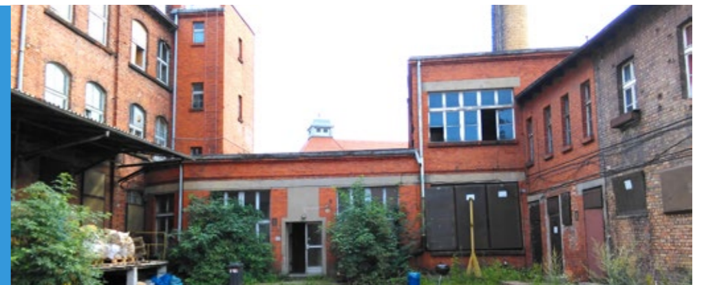
Industrialna przestrzeń Starej Papierni – nowa siedziba Zakładu.

Zawsze podziwiałem języcką inicjatywę, miejsce, gdzie można było wpaść, doszlifować drzwi do szafki, zmontować lampę, naprawić stary mikser, a przede wszystkim skorzystać z rzemieślniczej wiedzy i wsparcia – mówi radny Tomasz Dworek . Teraz kreatywnych młodych ludzi serdecznie witamy na Starym Mieście – dodaje.