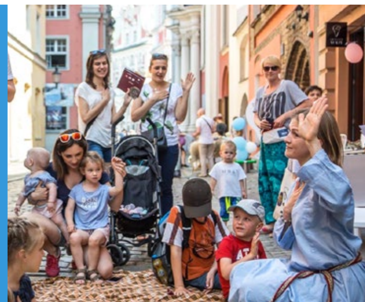
Gołębia inspiruje.

Poziom merytoryczny większości propozycji był bardzo wysoki. Zależy nam na aktywnym uczestnictwie w realizowanych przedsięwzięciach, aby poznaniacy mieszkający na Starym Mieście czuli się gospodarzami swojego fyrtla i byli odpowiedzialni za wspólną przestrzeń – podkreśla Zbigniew Burkietowicz, przewodniczący Zarządu Osiedla Stare Miasto.