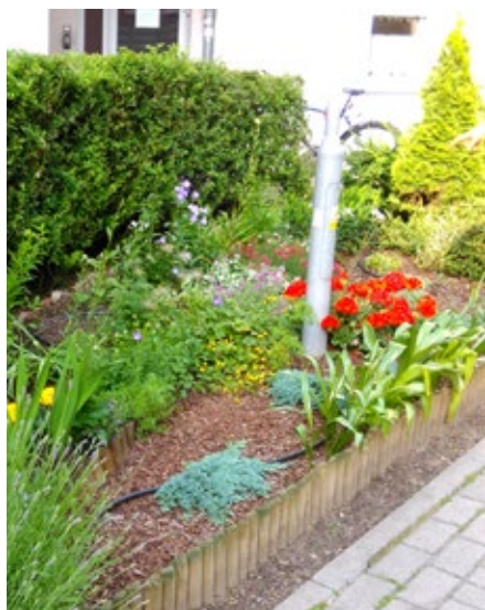
Sąsiedzki ogródek przy Szyperskiej