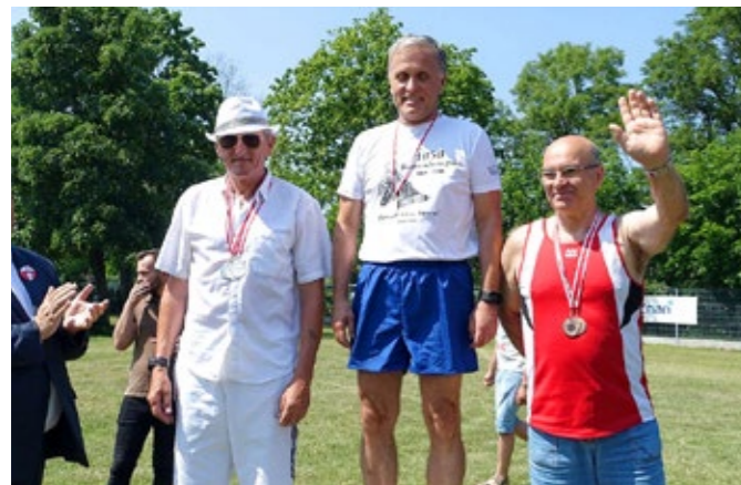
Medaliści Spartakiady Seniorów.