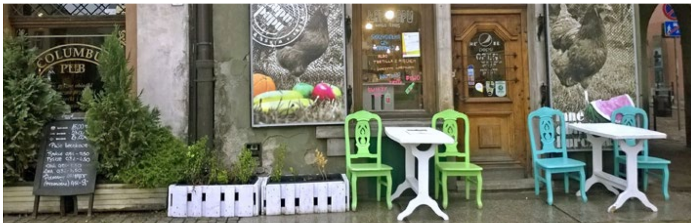
Tak nie powinno być