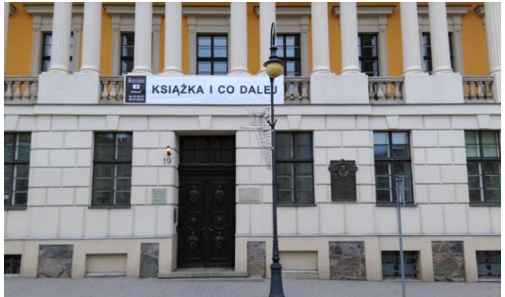
Biblioteka Raczyńskich.

Co liczy się dla decydentów? Czym kierują się władze Poznania? Czy zdanie ponad dwóch tysięcy aktywnych czytelników biblioteki w Centrum Kultury ZAMEK ma dla nich znaczenie? Czy rewitalizacja ul. Św. Marcin ma polegać