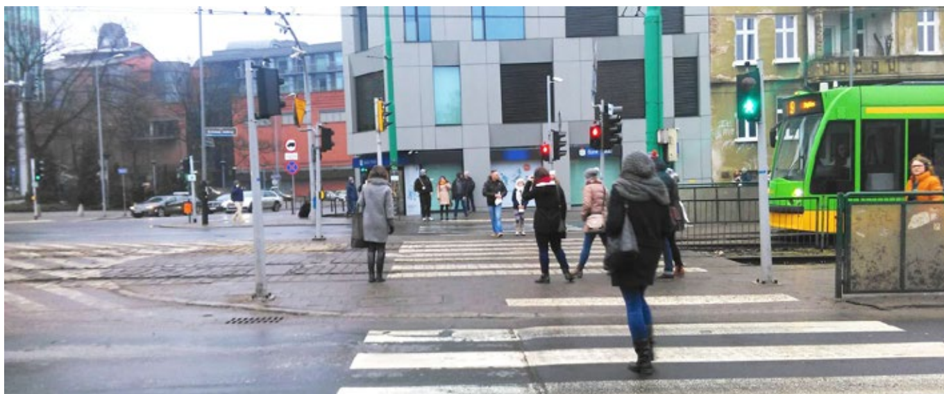
Ulica Królowej Jadwigi.