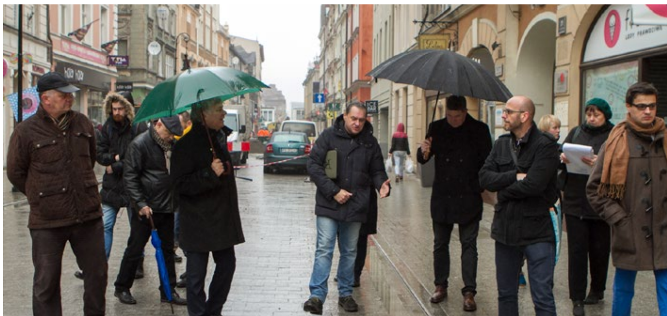
Radni mają mnóstwo zastrzeżeń do wykonania remontu ul. Wrocławskiej. Zarząd Dróg Miejskich obiecał realizację poprawek do końca kwietnia.

– Jako Rada Osiedla wspieramy oddolne inicjatywy mieszkańców i w ten sposób wspomagamy rozwój społeczeństwa obywatelskiego. To kolejne stowarzyszenie na Starym Mieście o profilu rewitalizacyjnym, powołane przy naszym wsparciu. Cieszymy się, że możemy w ten sposób współdziałać ze świadomymi i odpowiedzialnymi mieszkańcami – podsumowuje Andrzej Rataj, przewodniczący Rady Osiedla. ■