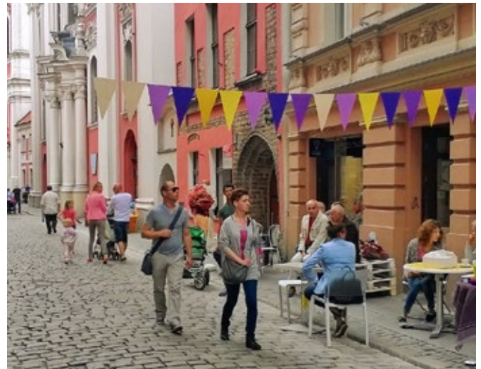
Gołębia inspiruje.