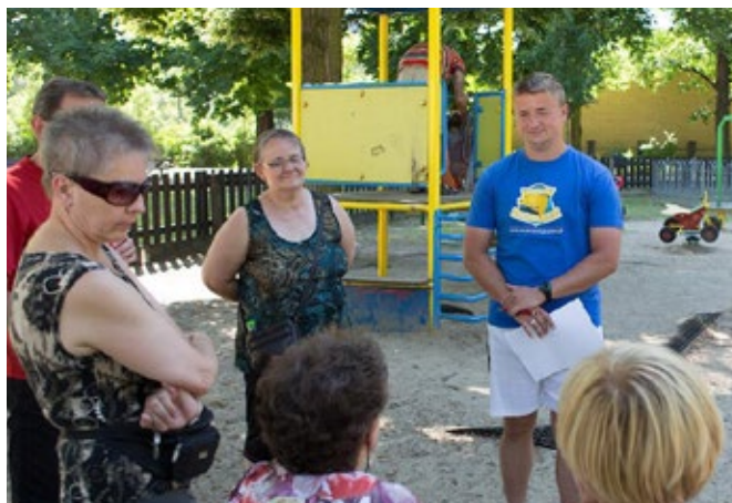
Trener osiedlowy wśród seniorów.

Oprócz zajęć na zewnętrznej siłowni zaplanowano m.in. naukę prawidłowej techniki marszu nordic walking odciążającej stawy, ćwiczenia wzmacniające gorset mięśniowy, zwiększające wydolność i spalające tkankę tłuszczową – wszystko po to, by lepiej sobie radzić z trudnościami dnia codziennego. Cały czas trwają zapisy na zajęcia, zapraszamy! ■