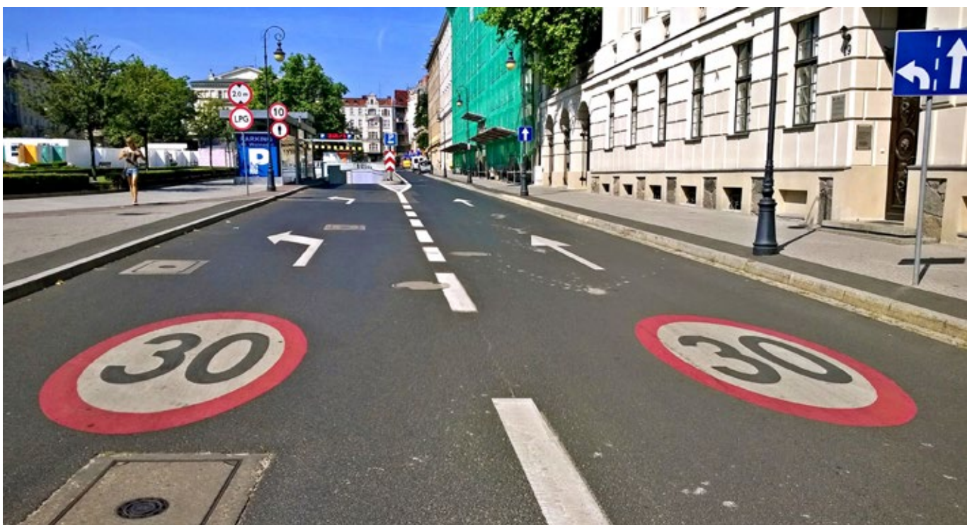
Mieszkańcy już dłużej nie chcą czekać na strefę Tempo 30.

Przewodniczący komisji: Jacek Maleszka, kontakt: jacek-maleszka@o2.pl