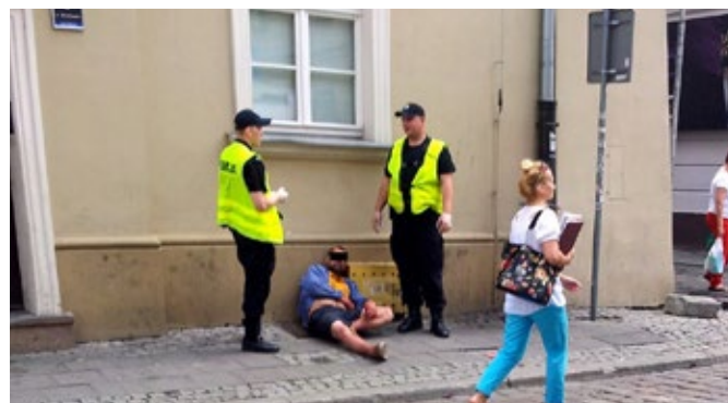
Częsty obrazek na deptaku na Wrocławskiej. Fot. Stow. Ulica Wrocławska

Radni wskazują też na problem osób wykluczonych potrzebujących opieki streetworkerów. Pomocy jednak muszą chcieć i sami wykluczeni. ■