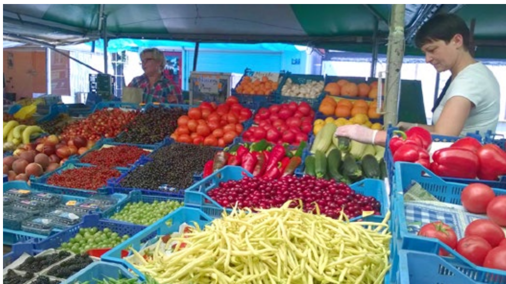
Plac Bernardyński to miejsce z klimatem do dobrych zmian.

Plac Bernardyński powinien być przede wszystkim miejscem spotkań poznaniaków. Musi stać się rynkiem z prawdziwego zdarzenia, a wzorem mogą być targowiska z powodzeniem funkcjonujące w miastach Europy Zachodniej, które tak podziwiają władze Poznania. To rynek marzeń – bez specjalnego zadęcia, ale za to z produktami, z których słynie Wielkopolska.