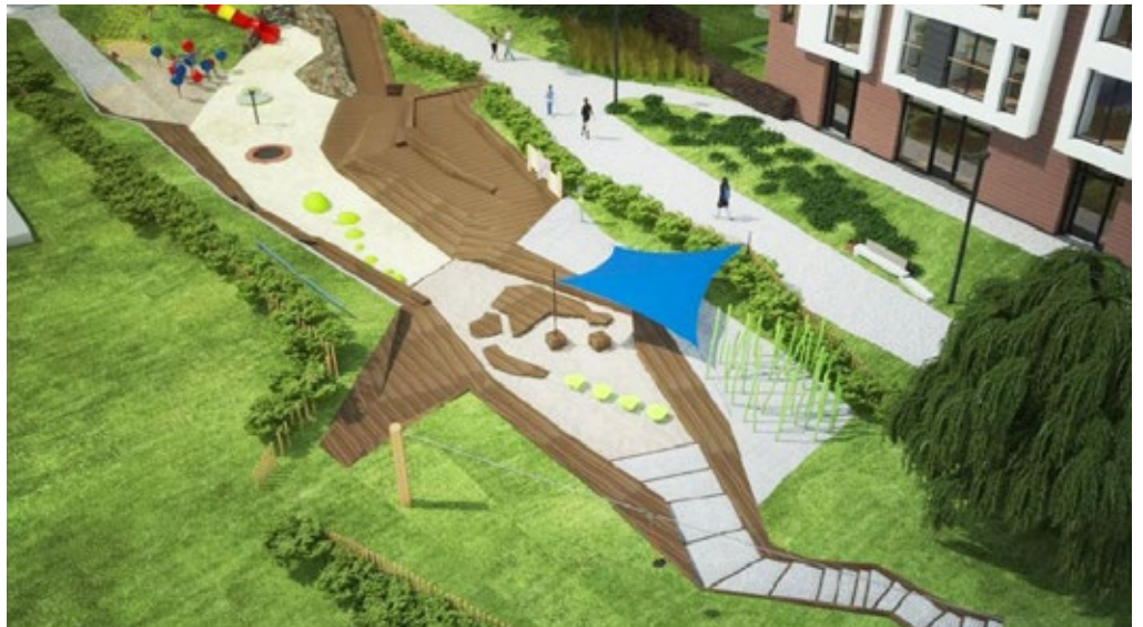
Wartofrajda – tak będzie wyglądał wyjątkowy plac zabaw

Mijają czasy, gdy miejscem zabaw było podwórko, trzepak czy zabałaganiony skwer, a przestrzeń dziecięcej rozrywki zajmowały parkujące samochody. Jednak dorośli, a w szczególności rodzice, mają coraz więcej obaw o to, gdzie i jak spędzają czas ich dzieci. Dlatego Rada Osiedla stara się o zmiany w naszej okolicy.