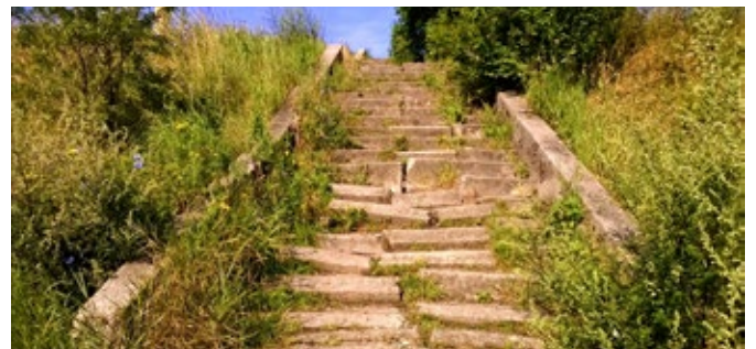
Zdemolowane schody nad Wartą

Rada Osiedla zwróciła się do nadzoru budowlanego z prośbą o niezwłoczną interwencję w celu przeprowadzenia rozbiórki zdemolowanej konstrukcji. Wiosną osiedlowy samorząd przeznaczył 70 000 zł na przebudowę schodów. Pierwotnie jednostki miejskie odmówiły podjęcia działań. Na szczęście jednak ostatnie rozmowy przeprowadzone z władzami miasta dają nadzieję, że nowe schody powstaną nad Wartą jeszcze w tym roku!